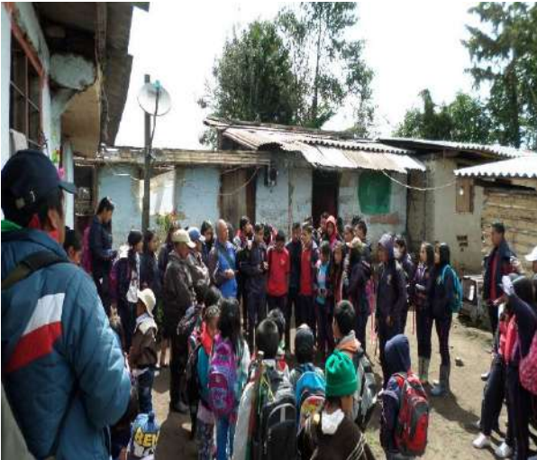
Ilustración 14. Conferencia de un Mayor Sabedor.

La autoridad tradicional está adelantando durante los últimos años eventos que tienen que ver con la retroalimentación del Plan de Vida, y de todos sus componentes. Está claro y se nota a partir de estas actividades que muchos docentes no están de acuerdo con este tipo de actividades, esto se refleja en la asistencia de algunos a encuentros, pero eso no ha frenado el deseo de otros de mejorar la propuesta del Cabildo por medio de la Coordinación de Educación. Se han adelantado visitas a las veredas con