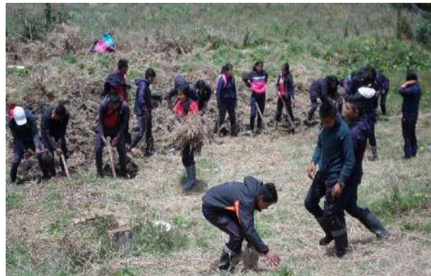
Ilustración 35. Minga de los Estudiantes en una sede escolar.