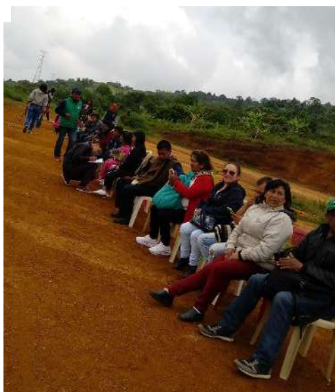
Ilustración 17. Ritual de Refrescamiento. Las Delicias. Buenos Aires.

Entre otras cosas que también se hizo en la Comunidad de las Delicias, fue el intercambio de la cultura y su reconocimiento por parte de los