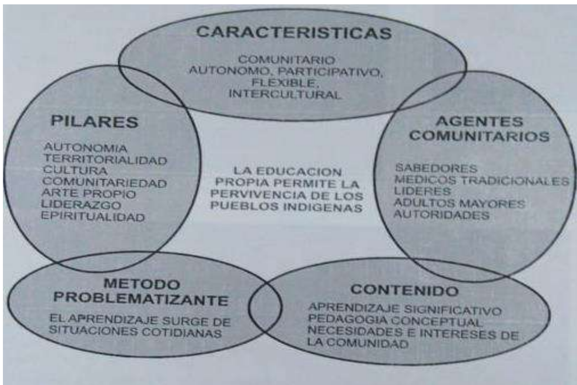
Ilustración 11. Estructura PEC.

A partir de aquí se puede hablar de una estructura del PEC, porque se determina en la propuesta lo que se debe hacer y cómo se debe hacer dentro de la institución educativa.