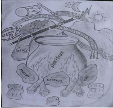
Ilustración 10. Tulpa de Conocimiento Pueblo Totoró.