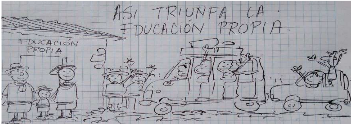
Ilustración 20. Caricatura Sobre Educación Propia. Fuente: Julián Rivera. Popayán 2018

“Llegara el día en que la educación propia se convierta en el transporte de las ideas de los pueblos indígenas”