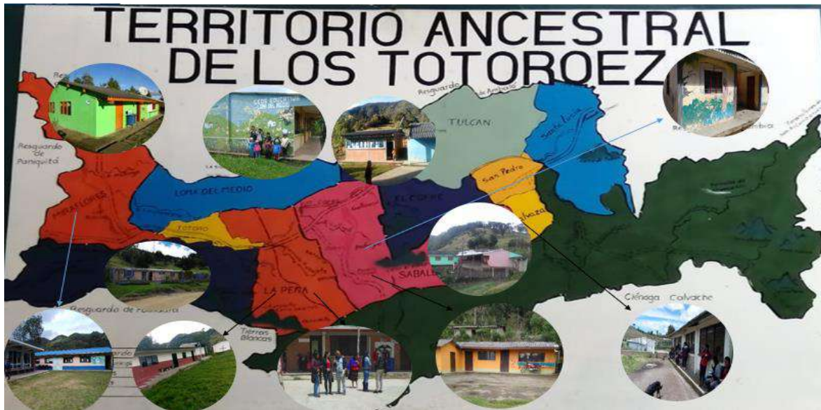
Ilustración 9. Territorio Ancestral Pueblo Totoroez y Sedes Escolares.

Luego de años de lucha por conformar una Institución de Carácter Indígena como había sido el sueño y el objetivo de líderes mayores de la comunidad, con la anterior resolución hacían aun comentarios: “los sindicatos grandes del país y del departamento, no estaban de acuerdo con la imposición de esta política educativa, ya que traería consecuencias negativas en contra de los trabajadores de la educación”, sin embargo y a pesar de todas las protestas que se presentaron en la época fue poco lo que se pudo hacer para frenar la propuesta y se empieza a aplicar la norma. Esta decisión trae como consecuencia la unificación de todas las mencionadas escuelas y pasa a convertirse en una de las instituciones más grandes del Municipio e inicia un nuevo reto que es la implementación del Sistema Educativo Propio en el territorio con el objetivo de mantener la lengua como principal característica del centro educativo.