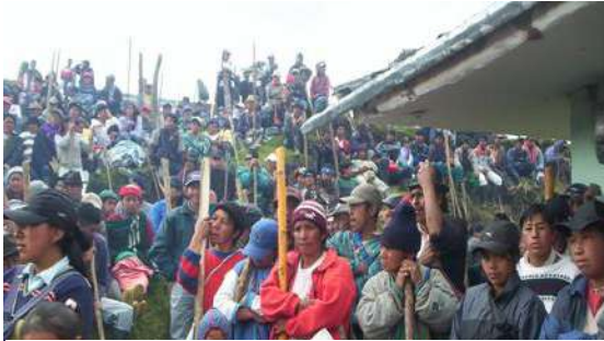
Ilustración 12 Asamblea Educativa Pueblo Totoró.

era lo que en verdad se quería. Debido a la división y diferencia entre los dos tipos de docentes (Comunitarios y Mestizos), fue muy difícil estar de acuerdo, unos querían el PEC