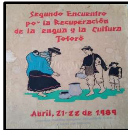
Ilustración 3. Segundo Encuentro por la Recuperación de la Lengua y la Cultura Totoró.

En el año de 1989 se realiza el segundo encuentro por la recuperación de la lengua y la cultura del resguardo, hecho este que significó el segundo momento en la realización de su proyecto de vida, que como lo manifiestan en los documentos se empezaron a direccionar mejor las acciones pertinentes para el trabajo comunitario y los inicios del proceso de educación propia. A continuación se encuentra lo que en el periódico de carácter regional del CRIC manifiesta sobre dicho evento.