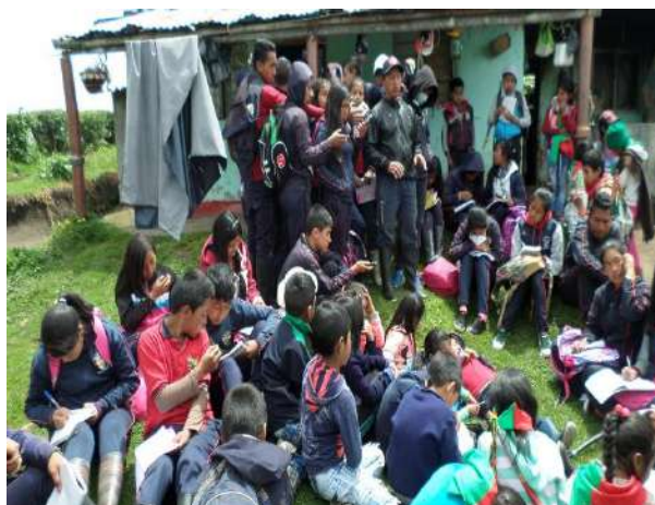
Ilustración 16. Conferencia con un Mayor Sabedor en su Vivienda.