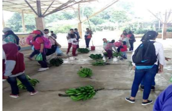
Ilustración 18. Trueque en las Delicias Buenos Aires.

Se realizó el trueque que también es una costumbre de todas las comunidades indígenas. Fue importante esta actividad porque la comunidad indígena de Totoró es de clima frío y por tanto sus productos también son de estas características; por otro lado, la comunidad de las Delicias se encuentra en un territorio de clima cálido y sus productos también varían.