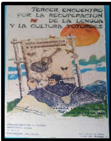
Ilustración 5. Tercer Encuentro por la Recuperación de la Lengua y la Cultura Totoroez.

Este encuentro, al igual que el anterior, se llevó a cabo en la vereda La Peña, durante los días 21 y 22 de abril de 1990, con la participación nuevamente de los centros educativos del Resguardo y de otros invitados de diferentes corregimientos y otras comunidades que quisieron conocer el proceso que se lleva dentro de esta actividad.