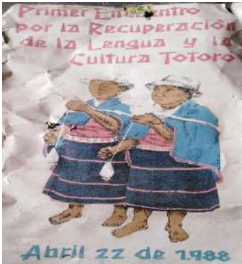
Ilustración 2. Primer Encuentro por la Recuperación de la Lengua y la Cultura Totoró.

Pasados 3 años después del inicio de la CECIB de San Rafael en la vereda la peña, y que su principal objetivo fuera el de recuperar y fortalecer la lengua Nam Trik, desde luego porque ya estaba en extinción, la autoridad propone darle un impulso a la enseñanza de la lengua tradicional, implementándose su enseñanza en todos los centros educativos existentes en el Resguardo. Además de esta propuesta el Magisterio de la zona y la Autoridad tradicional convocan al “1er encuentro por la recuperación de la cultura y la lengua Totoró”, quedaba escrito en el periódico “Unidad Indígena”, se realizaron eventos durante el día 22 de abril de 1988 en la vereda de Betania. También participaron de forma activa: