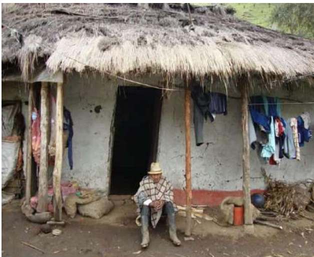
Ilustración 1. Casa Tradicional Pueblo Totoró

Namoi Kualmapik iskup amkun, Kilikmera pesenam+ntrap. (Revitalizando nuestra memoria, para no olvidar a nuestros mayores.)