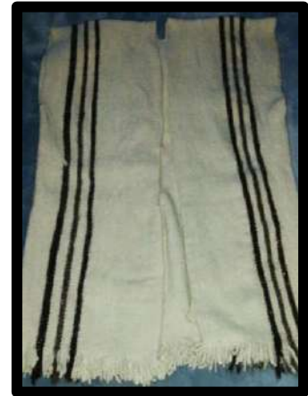
Ilustración 6. Capisayo o Turingo.

En el mismo evento hubo una exposición de artesanías como: ruanas, mochilas, chumbes, sombreros, con lo cual se pretende que los visitantes de otras comunidades aprecien y a la vez tengan en cuenta que aún se tiene viva la cultura y con mayor animo se dé continuidad a esta tarea emprendida”. (CRIC, Periodico Unidad Indígena. Unidad Alvaro Ulcue, 1990, pág. 3)