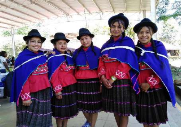
Ilustración 19 Grupo de Danza institución.

“Se ha de educar a todo el mundo sin distinción de razas ni colores. No nos alucinemos: sin educación popular, no habrá verdadera sociedad”