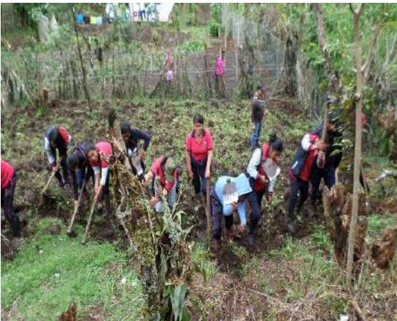
Ilustración 21. Minga en Huerta de un Líder.