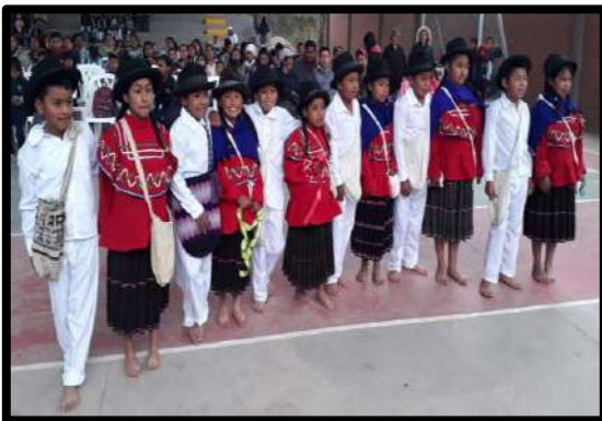
Ilustración 4. Vestido Tradicional Pueblo Totoró.

Igualmente hay que destacar la recuperación del vestido tradicional de la cultura Totoró (anaco hecho en lana de ovejo con varias listas y pañolón negro o azul para las mujeres y calzón blanco y turingo (ruana) para los hombres)”. (CRIC, Segundo Encuentro por la Recuperación de la Lengua y la Cultura Totoró, 1989, pág. 4).